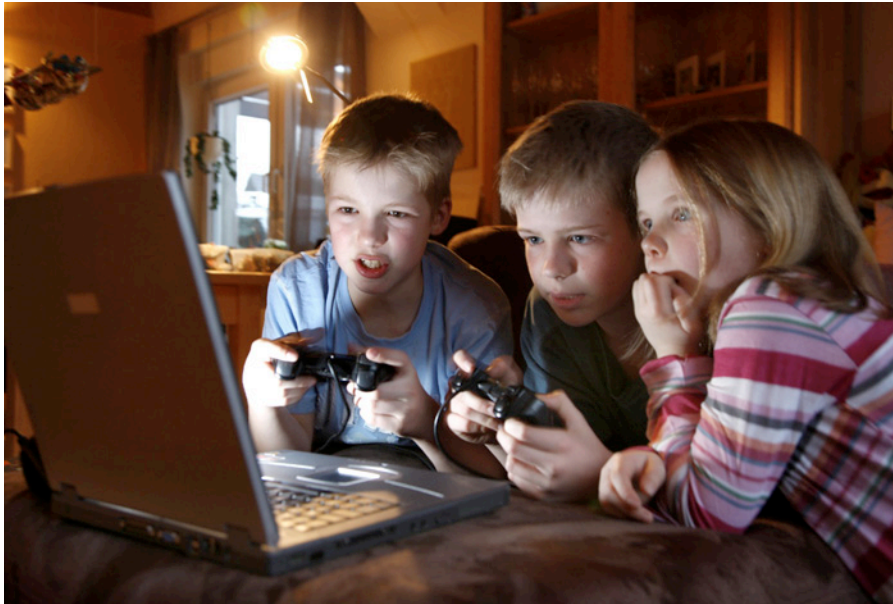
Mädchen chatten, Jungen gamen?

In den letzten Dekaden haben sich Medien und Kommunikationsmittel in einem rasanten Tempo entwickelt. Internet, E-Mail, Computer und Handy sind unverzichtbare Bestandteile der Arbeitswelt und ständige Begleiter in der Freizeit geworden. Mit dieser dynamischen Entwicklung haben vor allem Erwachsene zuweilen Mühe, war ihre mediale Sozialisierung doch wesentlich vom Vorabendprogramm im Fernsehen und von gelegentlichen Telefongesprächen mit dem Schulschatz geprägt. Die raumzeitliche «Rundum-Kommunikation», wie wir sie heute kennen, empfinden deshalb viele als Belastung. Insbesondere die unbegrenzten Möglichkeiten des Internet betrachten Erwachsene oft mit Argwohn.